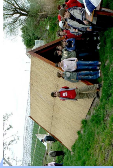
Kiadó: Bereztk Péter Természetvédelmi Klub Készítette: Ladányi Zsuzsanna